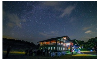
星空ヒュッテで満天の星空を鑑賞 ※8月30日まで