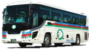
軽井沢駅からの無料送迎バス ※宿泊者専用