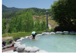
絶景の露天風呂で気分転換