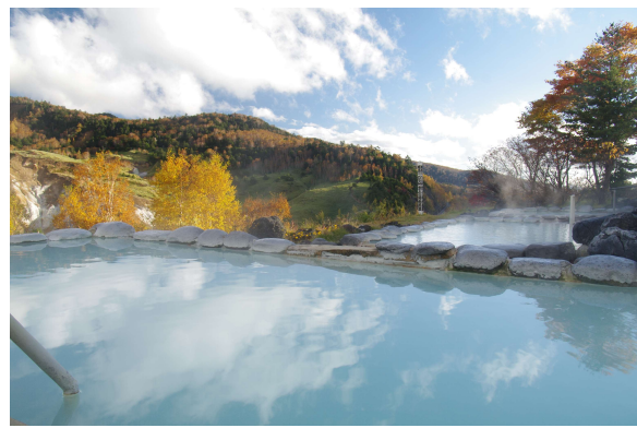
開放感満載の露天風呂