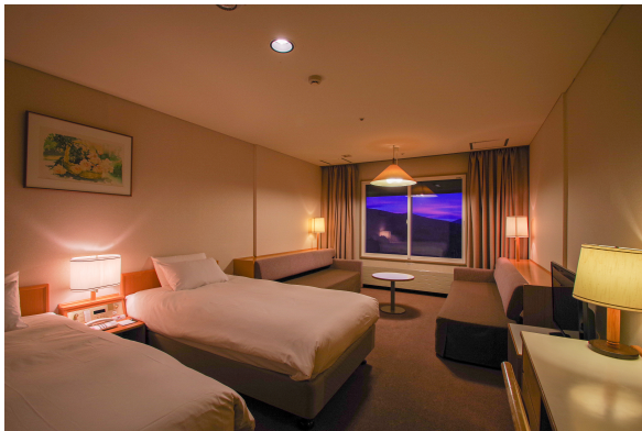
Wi-Fi 完備、38㎡のゆったりとした客室

プリンスホテルでは、お客さまにより安全で清潔な空間で快適にお過ごしいただけるよう、新たな衛生・消毒基準「Prince Safety Commitment(プリンス セーフティー コミットメント)」を策定し導入いたしました。安全で清潔な環境を作り、お客さまが快適なひとときをお過ごしいただけますよう準備をしてお待ちしております。