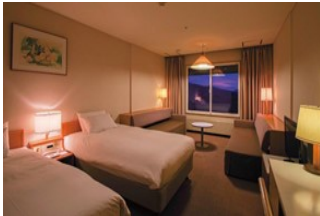
Wi-Fi 完備、38㎡のゆったりとした 客室