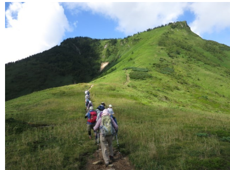
ホテル周辺をトレッキング ※イメージ