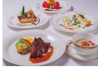
レストランコースメニュー ※イメージ