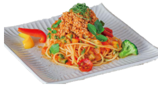
レストランア・ラ・カルトメニュー ※イメージ