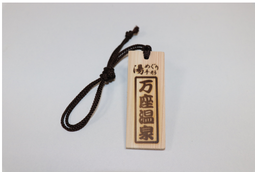
万座温泉湯めぐり手形