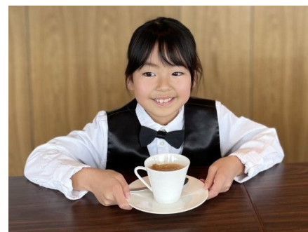
ゴールデンウィーク キッズプログラムイメージ