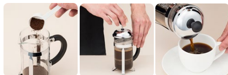
フレンチプレスイメージ