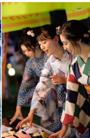
浴衣に着替えて縁日