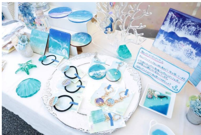
ブルーオーシャンをイメージしたレジアクセサリーなどをマルシェで販売

また、涼やかな音色とカラフルな約100個の風鈴が並ぶ夏らしいフォトスポットが8月31日(水)まで登場し、フォトジェニックな夏の思い出を彩ります。