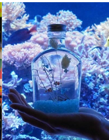
オリジナルのアクアリウムハーバリウムが作れるステイブラン