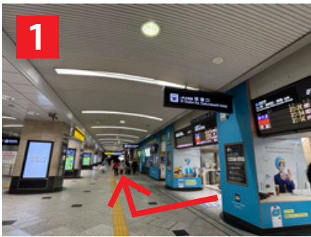
1 JR大阪駅「桜橋口」を出て右へ Exit JR Osaka Station 'Sakurabashi Exit' and turn right.