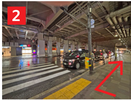
2 横断歩道手前で右折 Turn right before the pedestrian crossing.