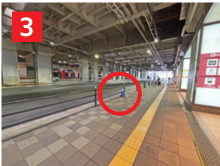
シャトルバス乗り場 Bus Stop