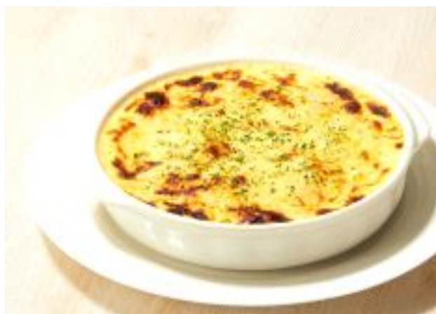
ビーフカレードリア Beef Curry Doria