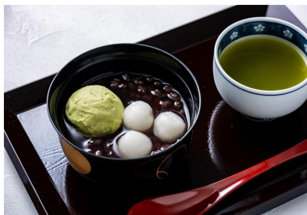
白玉ぜんざい Shiratama Zenzai