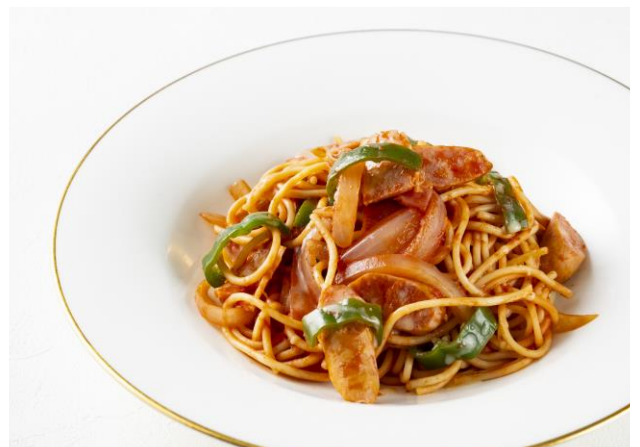
ナポリタンスパゲッティ Spaghetti Napolitan