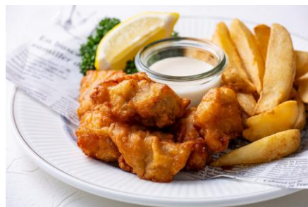
皮つきポテトとチキン Fried Potato & Chicken

※Please be advised that occasionally menu items change based on availability on the market.