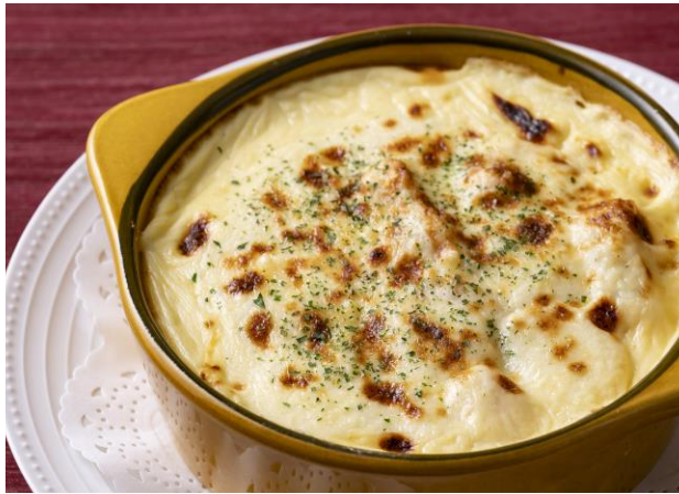
シーフードドリア Seafood Doria