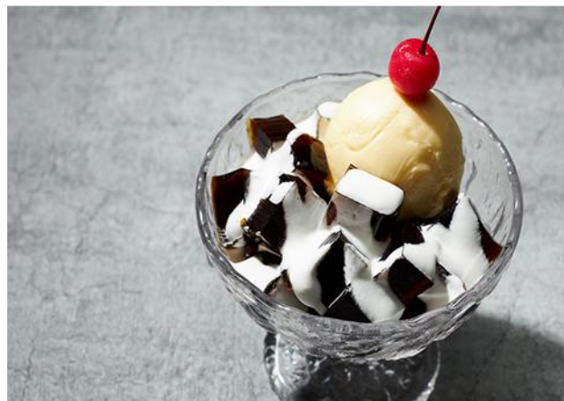
コーヒーゼリー Coffee Jellies