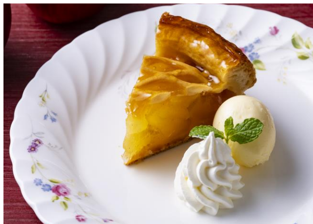
アップルパイアラモード Apple Pie A La Mode