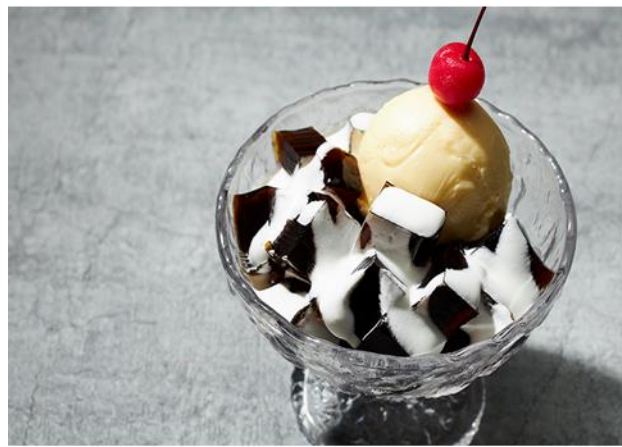
コーヒーゼリー Coffee Jellies