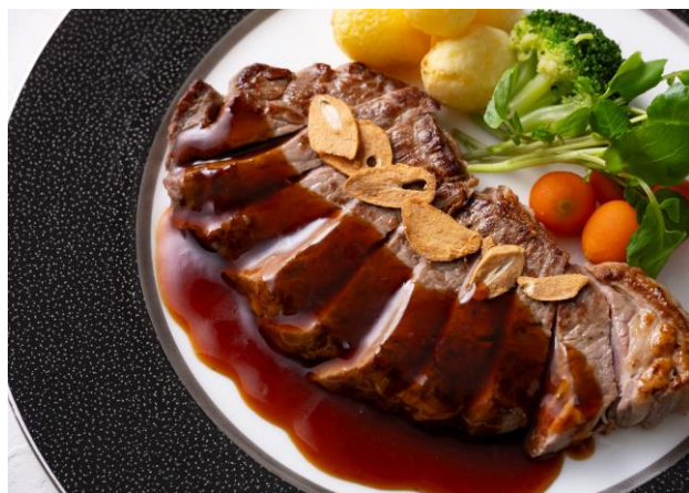
牛サーロインステーキ Beef Sirloin Steak