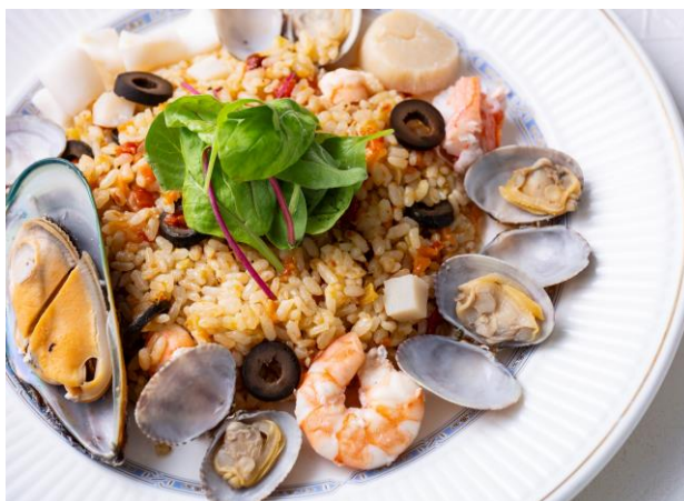
シーフードピラフ Seafood Pilaf