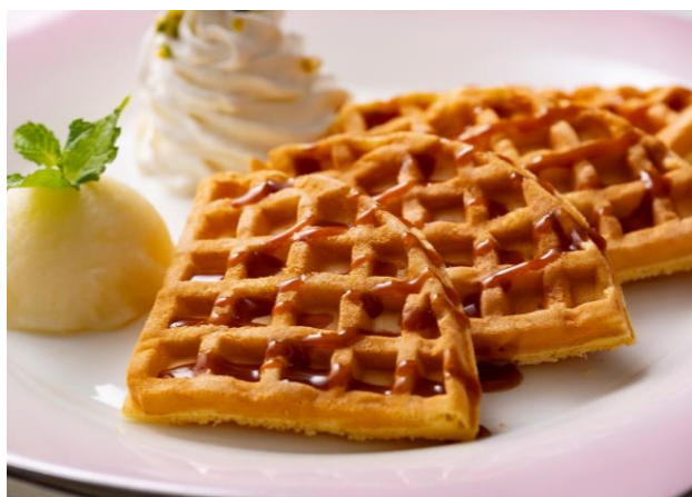
キャラメルワッフル Caramel Waffle