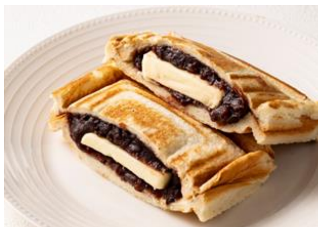
あんバターサンド Red Beans Paste & Butter Sandwich