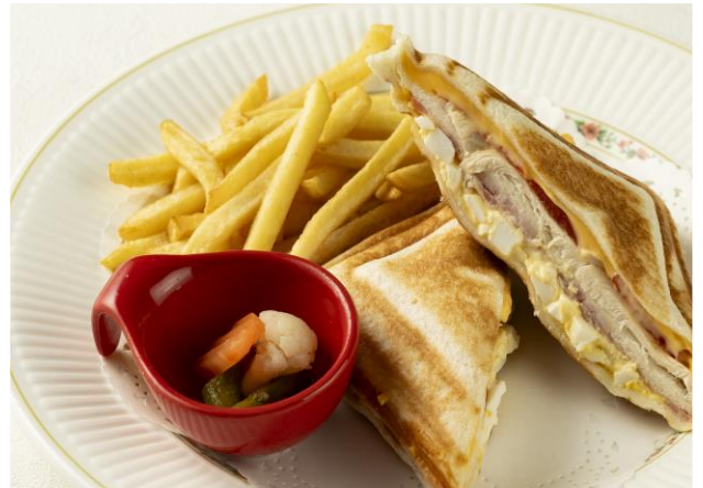
ホットサンドイッチ Hot Sandwich