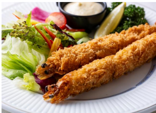
有頭エビのフライ Head-On Fried Prawn