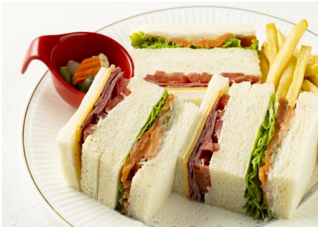
ミックスサンドイッチ Mixed Sandwich