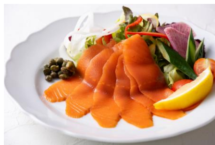
スモークサーモン Smoked Salmon

皮つきポテトとフライドチキン ¥1,900 サワークリームオニオンディップ Deep Fried Wedge Cut Potato & Chicken Sour Cream Onion Dip