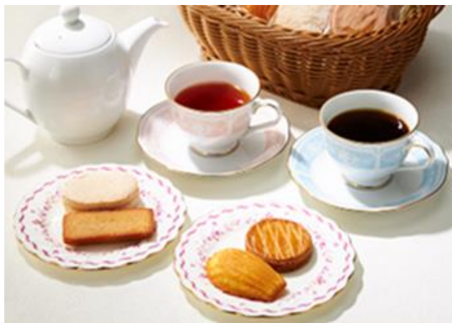
焼き菓子セット Daily Patisseries Drink Set