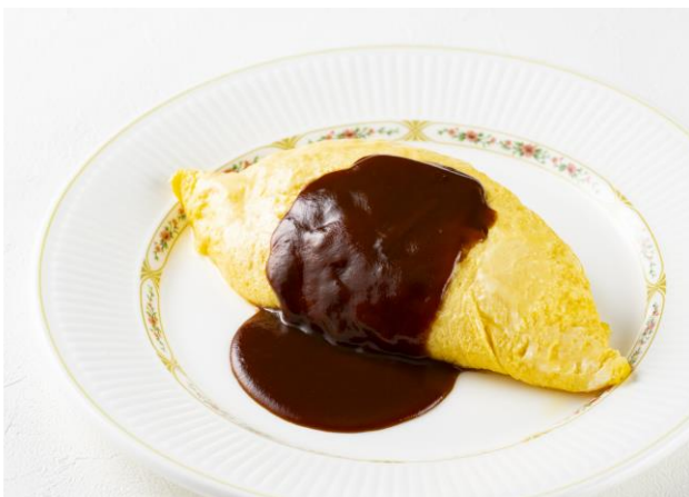
オムライス Omelet & Chicken Rice