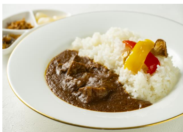
ビーフカレーライス Beef Curry & Rice