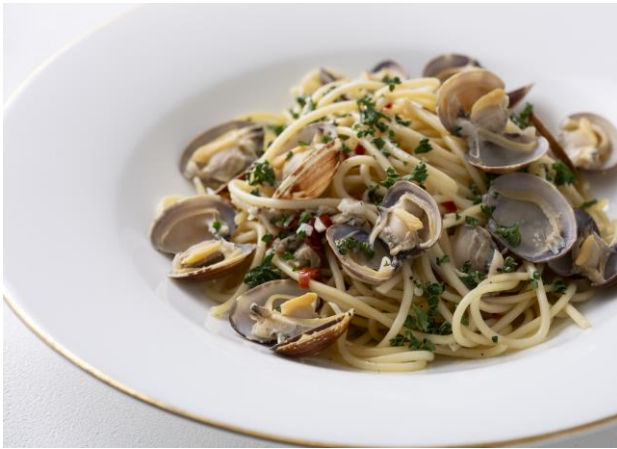
ボンゴレビアンコ Vongole Bianco