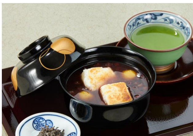
栗ぜんざい Chestnut Zenzai