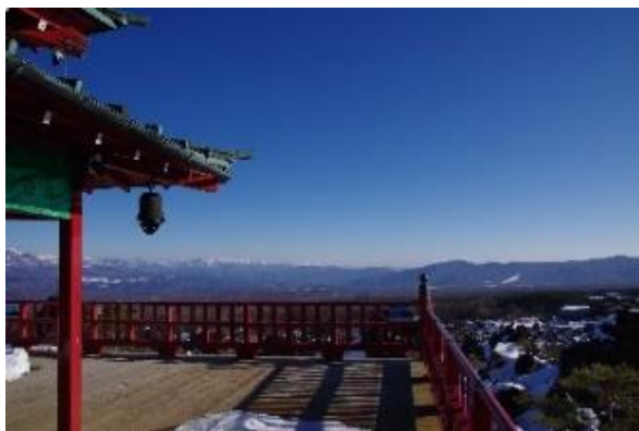
浅間山観音堂舞台

園内の惣門には鬼の形をした二天尊像が安置されています。門は江戸時代、上の寛永寺の学問所を移築し尊像は五代将軍綱吉公のお墓にお祭りされていた【持国天・増長天】になります。つまり悪者を防ぐ門番、鬼押し園の玄関のガードマンの役割です。このような事から、鬼押し園では「鬼は味方」です。浅間山観音堂の舞台から『健康で幸せに暮らせますように』と願いを込めて(福は内)と 3 回唱えてダイナミックに豆をまいてください。