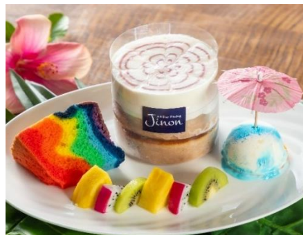
ハワイアンスタイルパンケーキ