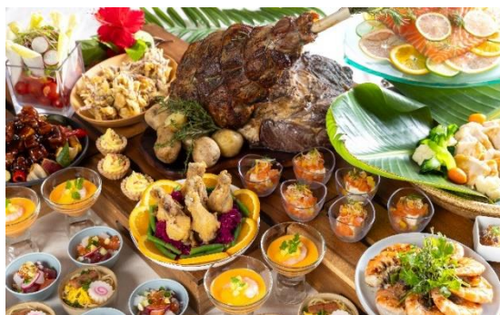
ディナーブッフェ

ハワイの代表的な料理や食文化を取り入れた南国リゾートを感じさせるブッフェ。シェフ特製の一品としてティーボーングリルやサーモンマリネのレアステーキを贅沢に盛り合わせた逸品もご用意。デザートには、「生絞りマカダミアナッツモンブラン」や紅芋&マンゴーフレーバーの「マラサダ」、色鮮やかな「レインボーシフォンケーキ」などをお楽しみいただけます。