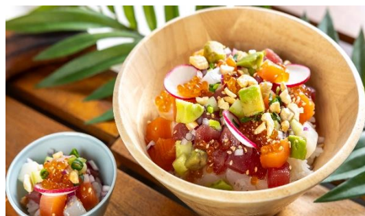
ハワイアンメニュー定番のシーフードポキボウル