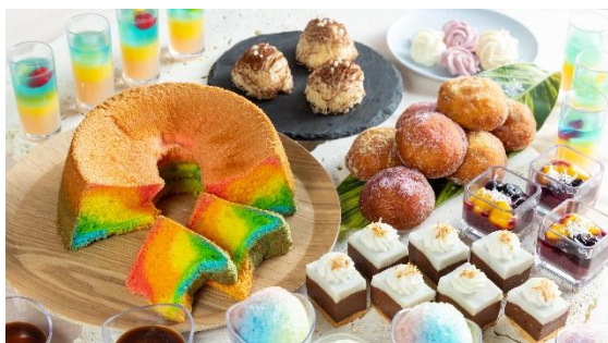
ブッフェにはトロピカルデザートもふんだんに！