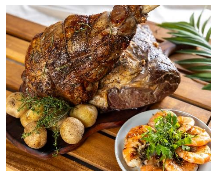
ジゴ・ダニョーケバブスタイル