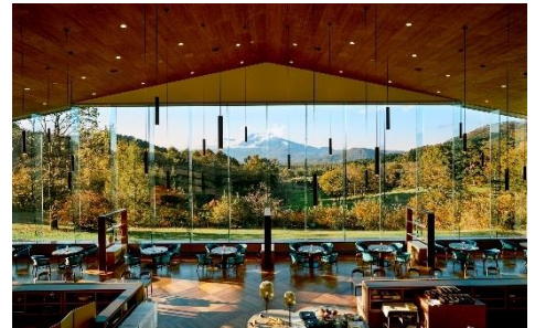
ダイニング ブルーム

高さ9mのパノラマウィンドウが特徴のダイニングにて、4種類のセイボリーと6種類のスイーツ、ミニハンバーガーを楽しめる軽井沢 浅間プリンスホテルオリジナルのアフタヌーンティー。日々の喧騒を忘れてゆったりとした時間をお過ごしいただける非日常感あふれる絶景レストランで軽井沢の豊かな自然と、雄大な浅間山を眺めながら贅沢な“ヌン活”をお楽しみください。