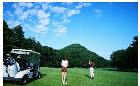
軽井沢 浅間ゴルフコース