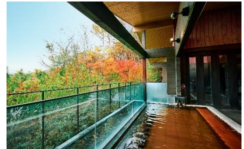
温泉棟「Breeze in Plateau」

浅間山の絶景が広がる温泉棟「Breeze in Plateau」。ホテルから温泉棟まではモノレールで約1分。なめらかに優しく包み込む温泉が日々の疲れを癒してくれます。女性風呂は肌に優しいミストサウナと広々としたパウダールームと脱衣所が特徴で、男性風呂はドライサウナと水風呂がございます。