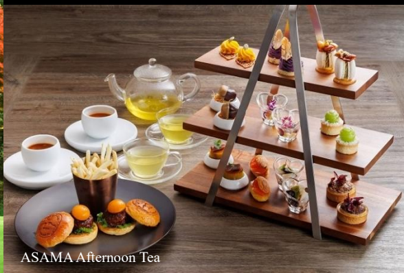
ASAMA Afternoon Tea