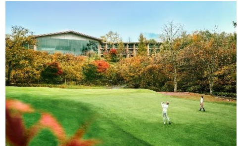
軽井沢 浅間ゴルフコース

軽井沢 浅間ゴルフコースは、雄大な浅間山を望み、から松やもみの木でセパレートされた美しいホールが特徴の2サム(2名1組)のプライベート感あふれるコースです。2名用の乗用ゴルフカートで気軽にラウンドでき、フェアウェー乗り入れ可能なため、疲れ知らずにゴルフを楽しめます。