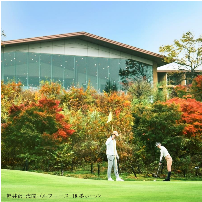
軽井沢 浅間ゴルフコース 18番ホール

浅間山を望む絶景の中でゴルフを楽しんだ後は、心身を癒やす温泉と、料理長こだわりのアフタヌーンティーをご堪能いただけます。