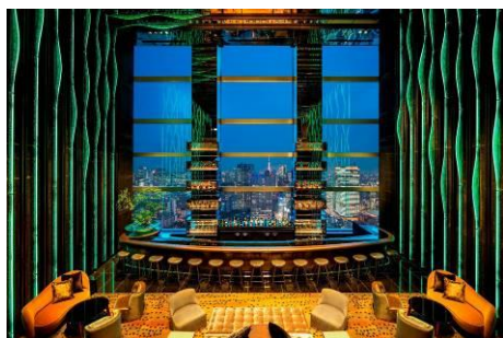
ザ・プリンスギャラリー 東京紀尾井町

当社は、日本国内を中心に 100 年以上の歴史の中で培ってきたノウハウを強みに、「日本をオリジンとしたグローバルホテルチェーン」への成長を掲げ、国内外 250 ホテル規模へ拠点拡大を目指しています。本年 9 月には、世界的ライフスタイルホテルブランド「エースホテル」を運営する AGI をグループに迎え、「エースホテル」の確立された世界観やカルチャーを最大限に尊重しながら、「地域との共生」という共通ビジョンのもと、共に歩み始めました。その土地ならではのサービスの提供を目指す両社にとって 1 ミシュランキーの獲得は、独自のブランド力を有するグローバルホテルオペレーターへの飛躍に向け、大きなステップとなります。ホテルでの滞在が、旅の目的となり、独自の個性と魅力を持った他にはない体験を提供するホテルとしてお客さまの期待に応えられるよう、さらなるブランド力およびサービスの向上を目指してまいります。