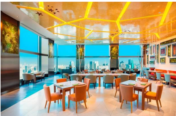
All-Day Dining OASIS GARDEN (36F)

【Web サイト】 https://www.princehotels.co.jp/kioicho/