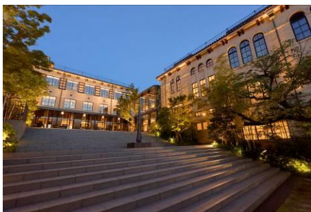
ザ・ホテル青龍 京都清水