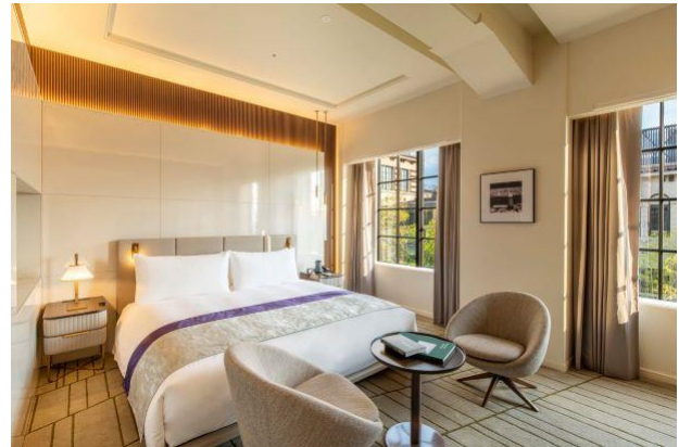
デラックスキング