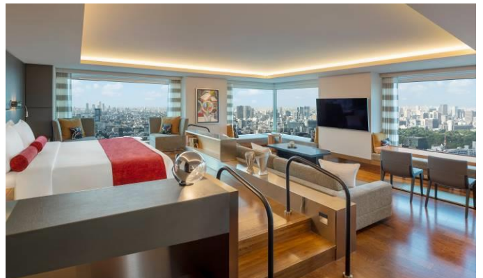
デザイナーズ スイート