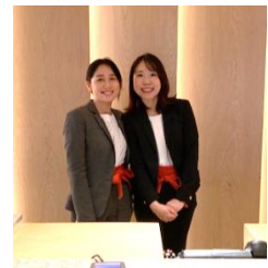
ザ・プリンス アカトキ ロンドンでの フロント勤務(右側が対象者)