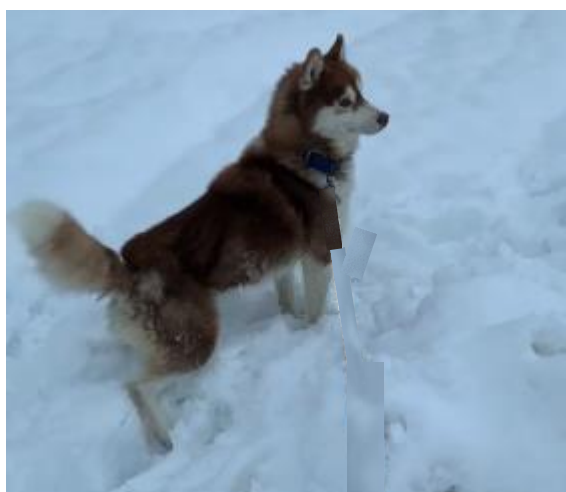
小型犬～大型犬エリア(2,950㎡):イメージ