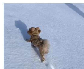
小型犬～中型犬エリア(1,450㎡):イメージ