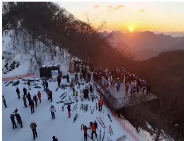
「初日の出リフト」山頂の様子(2025年元日)