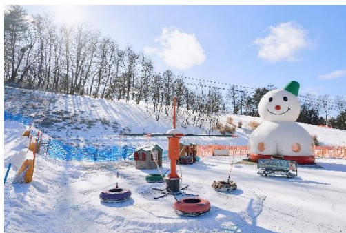
ウエストエリアの「スノーマンパーク」イメージ