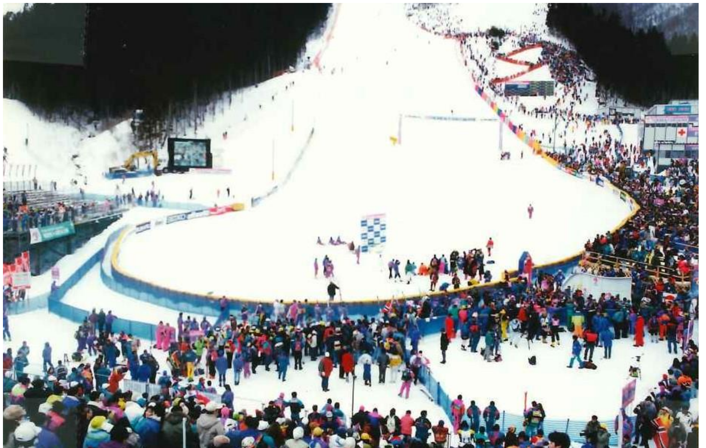
1993年に開催されたアルペンスキー世界選手権 盛岡・雫石大会の当時の様子