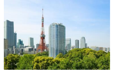
ザ・プリンス パークタワー東京の外観