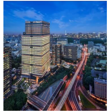
ザ・プリンスギャラリー 東京紀尾井町の外観