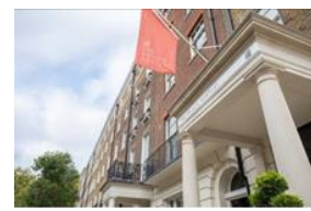
The Prince Akatoki London

©本件に関する報道各位からのお問合せ 株式会社西武・プリンスホテルズワールドワイド 広報部 TEL:03-6709-3302 FAX:03-6709-3400