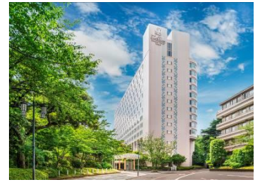
ザ・プリンス さくらタワー東京の外観