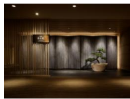
高輪 花香路 (グランドプリンスホテル高輪内)