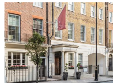
The Prince Akatoki London の外観