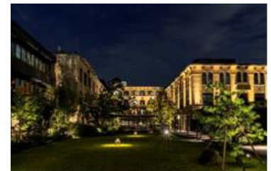
ザ・ホテル青龍 京都清水の夜の外観