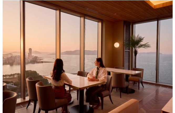
時間を気にせず過ごせるクラブラウンジ