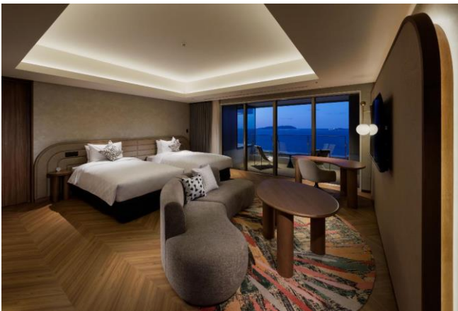
リトリートスイート

高層階である17～20Fのクラブフロアには、より上質なお滞在をお楽しみいただけるよう、2つのタイプの広々としたスイートルームを設置。リトリートスイートの浴室からは、目の前に広がる博多湾や玄界灘の絶景、福岡市内の夜景などをゆっくりと堪能することができます。