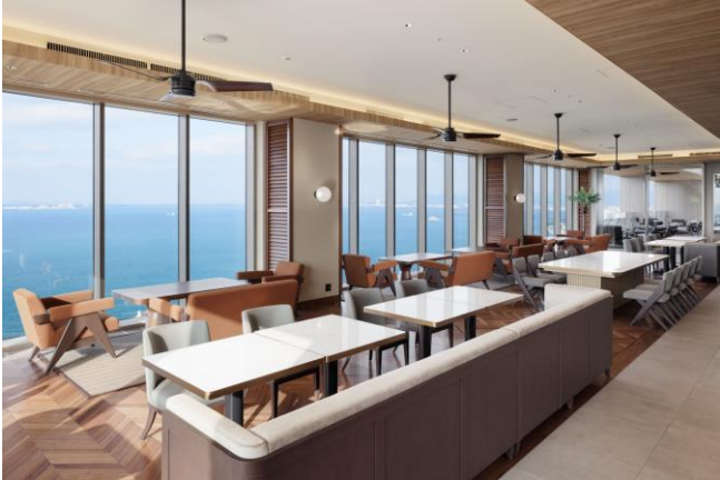
開放感あふれるクラブラウンジ

※コーヒー、オリジナルカクテルコーナーのほか、アルコール(7:00A.M.～9:00P.M.)もご用意しております。