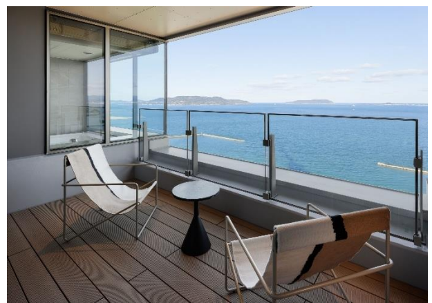
リトリートスイートのテラス