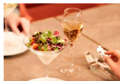
料理長おすすめのあまおうと生ハムのカプレーゼ仕立て