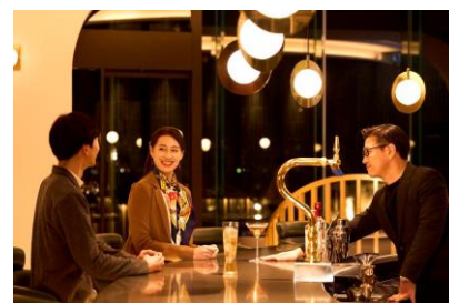
夜はバーエリアでお酒も楽しめる