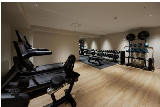
フィットネスジム