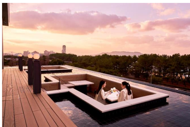
アウトドアテラス席から眺める夕景も印象的