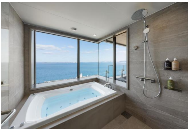
目の前に広がる海を一望できるバスルーム