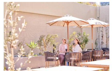
エントランス横にはカフェスタンドが併設されている