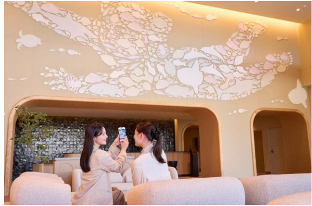
中村弘峰氏による壁画が印象的なロビーエリア