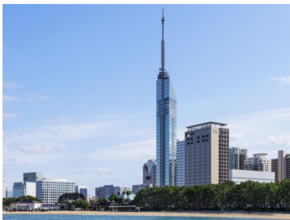
福岡タワーに隣接する「福岡プリンスホテル ももち浜」外観

当社はホテル運営に特化した会社「西武・プリンスホテルズワールドワイド」として、「日本をオリジンとしたグローバルホテルチェーン」を掲げ、国内外250ホテル規模への事業拡大を目指しています。福岡市においては2022年10月に宿泊特化型のホテル「プリンス スマート イン 博多」を開業しておりますが、基幹ブランド「プリンスホテル」では福岡市内において初の出店となります。