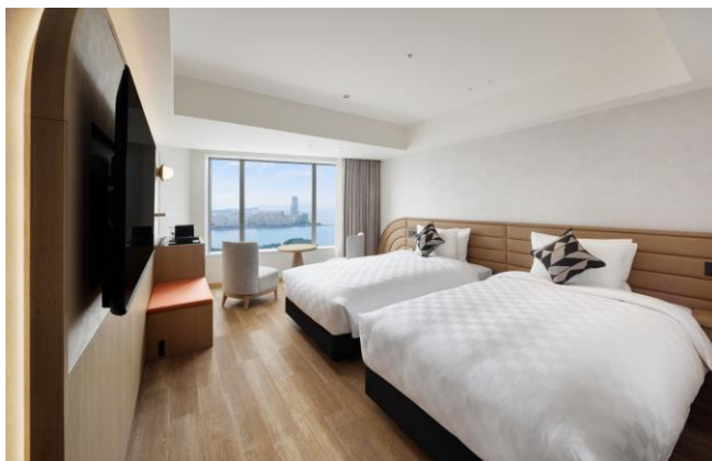
スーパーアツインルーム

平均 32 m 2 の広々とした空間を誇り、ゆったりとしたホテル滞在をお楽しみいただけます。一部の客室はグループでのご利用を想定し、エキストラベッドを備え、最大 3 名までご利用いただけます。