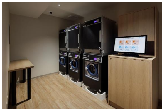
ランドリーも完備