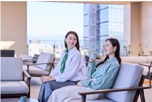
クラブラウンジに併設されたテラスで風を感じながら過ごせる