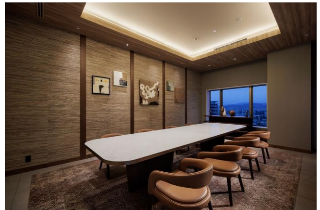
クラブラウンジにも個室を完備