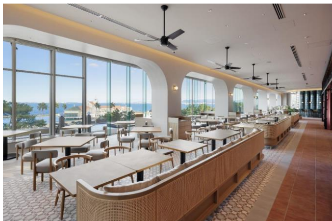
大きな窓が印象的なレストラン内観

※ランチタイムよりテラス席をご利用いただく場合は、1卓 ¥2,000(税込み)を頂戴いたします。