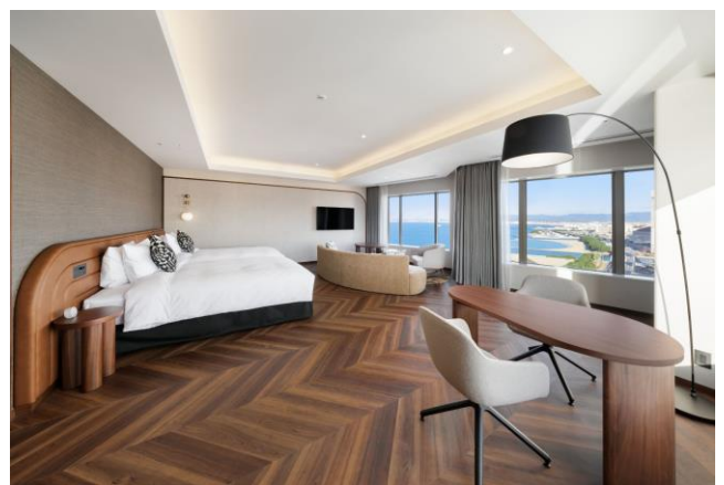
ももち浜スイートルームは海とライトアップする福岡タワーが楽しめる