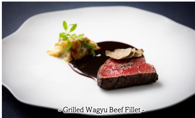
- Grilled Wagyu Beef Fillet -