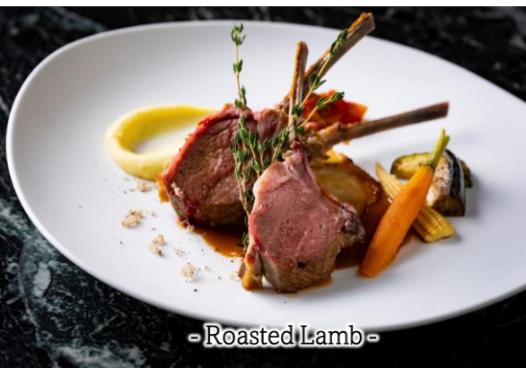
- Roasted Lamb -

Assorted Sausages ※This dish contains Pork ソーセージ盛り合わせ