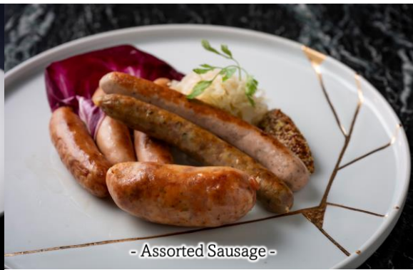
- Assorted Sausage -

Price includes consumption tax. Additional 15% will be added for service charge. ※表記料金には消費税が含まれております。別途会計時にサービス料（15%）を加算させていただきます。