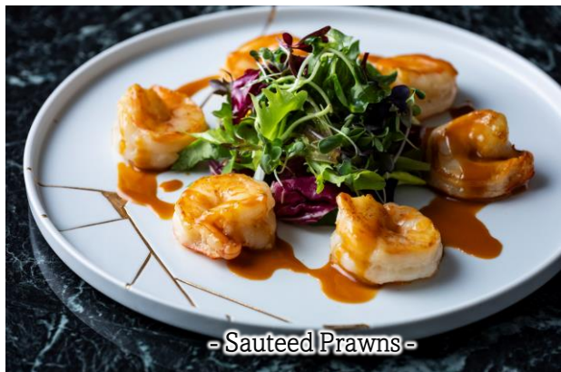
- Sauteed Prawns -