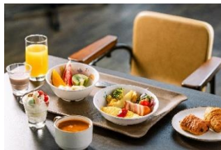
朝食buffet(お子さま) イメージ

お子さまにはカラフルドーナツやフライドポテトなどもご用意しており、ご家族皆さままでお楽しみいただけます。