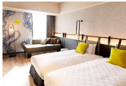
スーペリアツインルーム イメージ

全客室にシモンズ製ベッドを導入し、最大4名さままでご宿泊可能なゆとりある設計。機能性と快適性を兼ね備えた空間で、日常を離れた上質なステイをお楽しみいただけます。