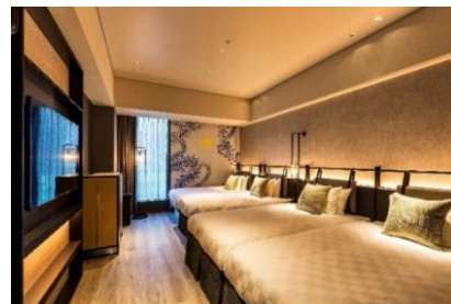
スーパーアツインルーム(2F～11F) 29.7㎡ ※4名利用時