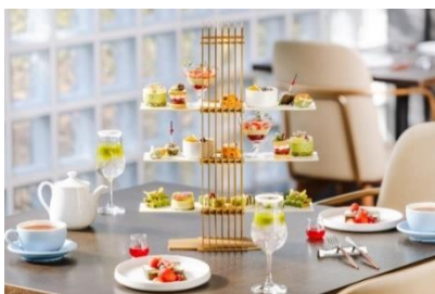
6/30 まで開催「とろける抹茶アフタヌーンティー」

季節ごとのアフタヌーンティーやケーキセットをお楽しみいただけます。彩り豊かなスイーツとともに、優雅なひとときをお過ごしください。