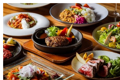
ディナー イメージ

四季折々の国産食材とフレンチの技法が織りなす“ジャパニーズフレンチ”。アラカルトからコース、お子さまメニューまで、季節の味覚を気軽に楽しめます。