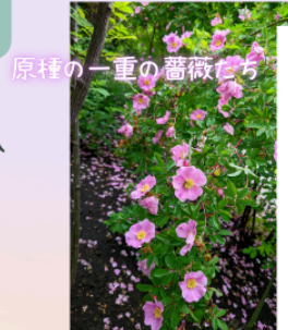
原種の一重の薔薇たち