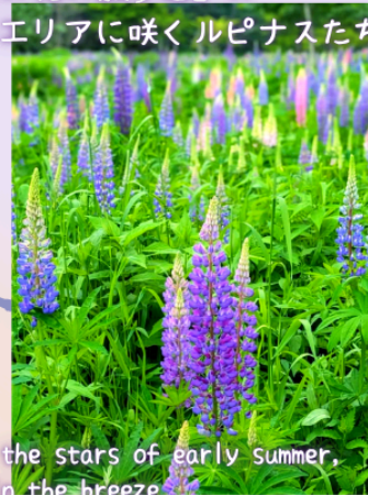
Lupines, the stars of early summer, swaying in the breeze.