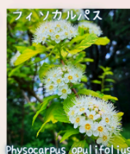
フィソカルパス Physocarpus opulifolius