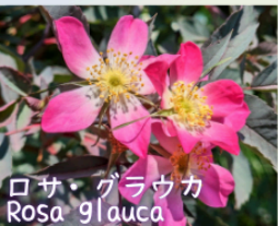
ロサ・グラウカ Rosa glauca

庭は花々だけじゃない、緑の匂いや木漏れ日、池辺に住む生き物たち、自然と共に美しく息づく季節。