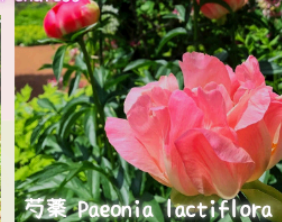
芍薬 Paeonia lactiflora