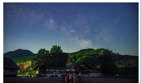
星空観賞会:イメージ