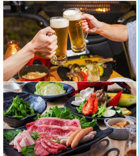
上州味めぐりバーベキューコース:イメージ