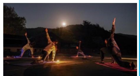
満月ストレッチ:イメージ

※参加費はいずれも無料、各回約 30 分、20 名定員となります。悪天候時はホテル館内にて実施いたします。