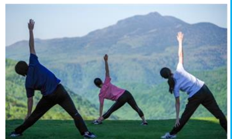
朝のストレッチ:イメージ